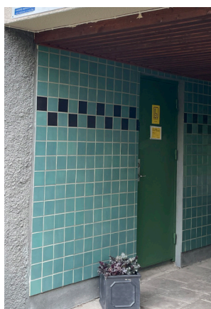
Här ligger förvaltarkontoret

Snart slipper vi de flaggande taken på höghusen. De kommer att få ny färg under sommarperioden.