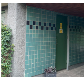
Här ligger förvaltarkontoret

När höstens mörker gör sig påmind kommer vi att göra provmontage med en annan typ av armaturer i stolpbelysningen på gård 2 (vi börjar där då det finns två trasiga stolparmaturer på den gården). Om vi är nöjda med resultatet kommer resten av armaturerna på sikt att bytas ut.