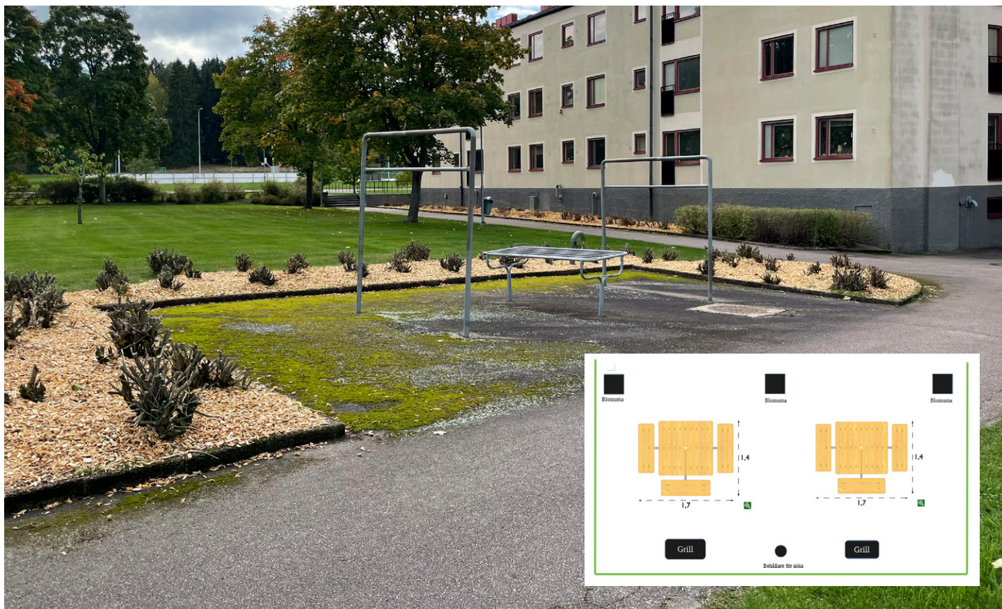
En av platserna där det planeras en ny grillplats