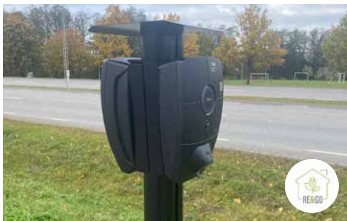
De nya laddarna från ReGo