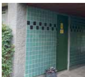
Här ligger förvaltarkontoret

Översyn av föreningens ordnings- och trivselregler pågår. Tanken är att de ska ligga lättillgängligt på hemsidan så att alla lätt kan söka fram vad som gäller i föreningen.